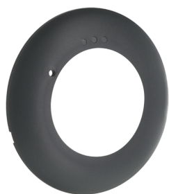
Anel de cobertura PD2N FC Número: 93771

Tensão: através do bus KNX Dimensões: Ø 83 x 55 mm Consumo de corrente: 12 mA