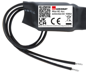
Mini-Kit Anti-arc Art.No: 10882

Batterie: 3.0 V Lithium CR2032 (compris dans la livraison) Dimensions: 80 x 60 x 8 mm Couleur du matériau: -