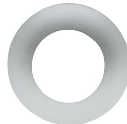
Collerette PD9 Ø 36 mm Art.No: 92237

Niveau de protection: IP65 Boîtier: Polycarbonate, UV-résistant Couleur du matériau: transparent