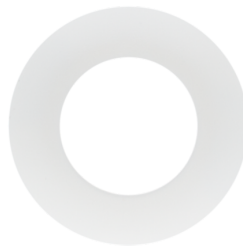
Collerette PD9 Ø 36 mm Art.No: 92238

Tension: 230 V AC \pm 10\% Dimensions: 50 x 23 x 8 mm Niveau de protection: IP20 / Classe II