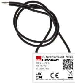
Kit Anti-arc Art.No: 10880

Dimensions: 40 x 55 x 103 mm Couleur du matériau: noir Fréquence: 2.4 GHz ISM-Band, GFSK 0.2 dBm + 5.3 dBi = 5.5 dBm