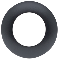
Collerette PD9 Ø 36 mm Art.No: 92235

Tension: 230 V AC \pm 10\% Dimensions: 38 x 12 x 26 mm Niveau de protection: IP20 / Classe II