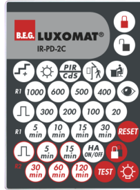
IR-PD-2C Art.No: 92475

Dimensions: Ø 36 mm Boîtier: Polycarbonate, UV-résistant Couleur du matériau: anthracite brillant