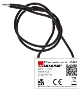
Kit Anti-arc Art.No: 10880

Batterie: 3.0 V Lithium CR2032 (compris dans la livraison) Dimensions: 57 x 35 x 7 mm Couleur du matériau: -