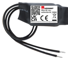
Mini-Kit Anti-arc Art.No: 10882

Tension: 230 V AC ±10% Dimensions: 38 x 12 x 26 mm Niveau de protection: IP20 / Classe II