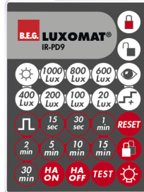
IR-PD9 Art.No: 92201

Dimensions: 40 x 55 x 103 mm Couleur du matériau: noir Fréquence: 2.4 GHz ISM-Band, GFSK 0.2 dBm + 5.3 dBi = 5.5 dBm