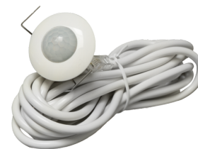
PD9-S-SDB-FP Art.No: 92915

Tension: 230 V AC ±10% Dimensions: 50 x 23 x 8 mm Niveau de protection: IP20 / Classe II