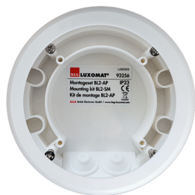
Kit de montage BL2-AP Art.No: 93256

Tension: 110 - 240 V 50 / 60 Hz Dimensions: Ø 80 x 61 mm Puissance interne: 0.3 W