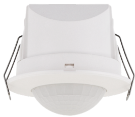
BL2-PLUS-FP Art.No: 93405

Pour obtenir le bundle conformément à la spécification technique, veuillez commander les articles mentionnés.