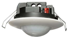
PD2N-KNXs-DX-FT Nº de artículo: 93512

Para recibir el paquete conforme a las especificaciones técnicas, pida los artículos indicados.