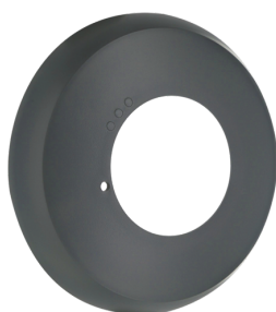
Anillo embellecedor PD2N EM Nº de artículo: 93761

Tensión de alimentación: via bus KNX Dimensiones: Ø 106 x 42 mm Consumo de corriente: 12 mA