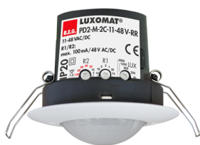
PD2-M-2C-12-48V-RR-FT Nº de artículo: 92306

Para recibir el paquete conforme a las especificaciones técnicas, pida los artículos indicados.