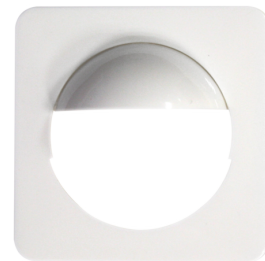
Adaptador central Indoor 180 56x56 Módulo2 Nº de artículo: 35127

Dimensiones: 56 x 56 mm Carcasa: Policarbonato de alta calidad Color de material: blanco puro brillo, similar RAL9010