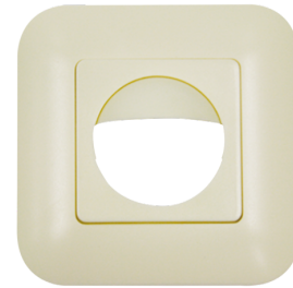
Marco embellecedor IP20 Indoor 180 Nº de artículo: 92632

Dimensiones: 87 x 87 mm Grado de protección / Clase: IP54 Carcasa: Policarbonato de alta calidad