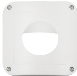
Marco embellecedor IP54 Indoor 180 Nº de artículo: 92139

Dimensiones: 86 x 86 mm Grado de protección / Clase: IP20 Carcasa: Policarbonato de alta calidad