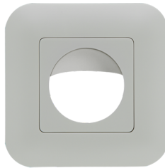
Marco embellecedor IP20 Indoor 180 Nº de artículo: 92630

Batería: 3.0 V Litio CR2032 (incluida) Dimensiones: 57 x 35 x 7 mm Color de material: -