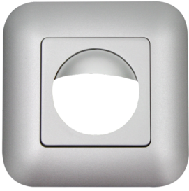
Marco embellecedor IP20 Indoor 180 Nº de artículo: 92633

Dimensiones: 86 x 86 mm Grado de protección / Clase: IP20 Carcasa: Policarbonato de alta calidad