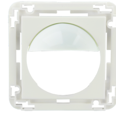
Adaptador central Indoor 180 45x45 Nº de artículo: 38947

Dimensiones: 88 x 88 x 42 mm Grado de protección / Clase: IP54 Resistencia a impactos: IK05