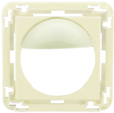
Adaptador central Indoor 180 45x45 Nº de artículo: 39076

Dimensiones: 45 x 45 mm Color de material: blanco tráfico mate, similar RAL9016