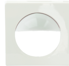
Adaptador central Indoor 180 55 x 55 mm Nº de artículo: 39241

Dimensiones: 55 x 55 mm Carcasa: Policarbonato de alta calidad Color de material: blanco puro brillo, similar RAL9010