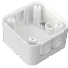
Zócalo para modelos SU Indoor 180 Nº de artículo: 92141

Dimensiones: 86 x 86 mm Grado de protección / Clase: IP20 Carcasa: Policarbonato de alta calidad