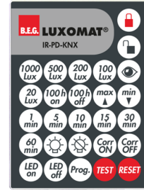
IR-PD-KNX Nº de artículo: 92123

Dimensiones: 47 x 19 x 10 mm Grado de protección / Clase: IP20 Temperatura ambiental: -20 °C a +40 °C