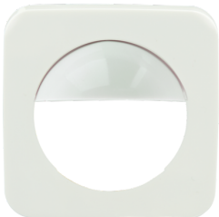
Adaptador central Indoor 180 55x55 Nº de artículo: 39242

Dimensiones: 55 x 55 mm Carcasa: Policarbonato de alta calidad Color de material: Blanco señal brillo, similar RAL9003