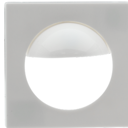
Adaptador central Indoor 180 55 x 55 mm Nº de artículo: 39222

Dimensiones: 45 x 45 mm Carcasa: Policarbonato de alta calidad Color de material: blanco perla mate, similar RAL1013