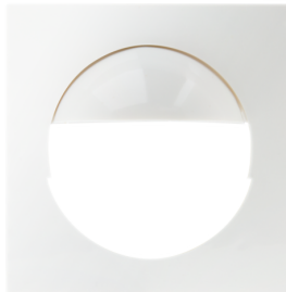
Adaptador central Indoor 180 S1 56x56 Nº de artículo: 35126

Dimensiones: 55 x 55 mm Carcasa: Policarbonato de alta calidad Color de material: blanco tráfico brillo, similar RAL9016