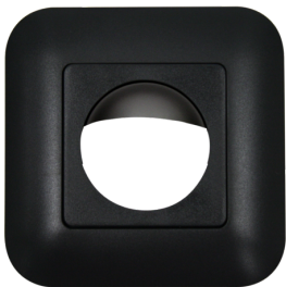
Marco embellecedor IP20 Indoor 180 Nº de artículo: 92634

Dimensiones: 86 x 86 mm Grado de protección / Clase: IP20 Carcasa: Policarbonato de alta calidad