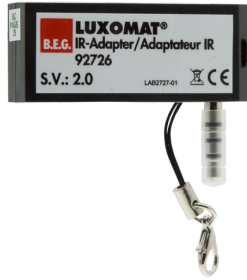
Adaptador IR para smartphones Nº de artículo: 92726

Dimensiones: 40 x 55 x 103 mm Color de material: negro Frecuencia: 2.4 GHz Banda ISM, GFSK 0.2 dBm + 5.3 dBi = 5.5 dBm