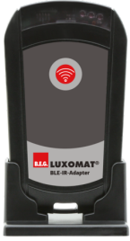
Adaptador BLE-IR Nº de artículo: 93067

Dimensiones: 40 x 55 x 103 mm Color de material: negro Frecuencia: 2.4 GHz Banda ISM, GFSK 0.2 dBm + 5.3 dBi = 5.5 dBm