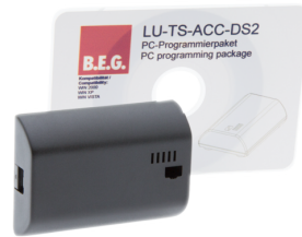
TS-ACC-DS2 Art.No: 92685

Spannung: 230 V AC 50 / 60 Hz Stromaufnahme: 10 mA Umgebungstemperatur: +5 °C bis +35 °C