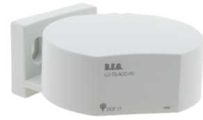
TS-ACC-FE Art.No: 92683

Stromaufnahme: 10 mA Umgebungstemperatur: +5 °C bis +35 °C Gehäuse: POM, PC