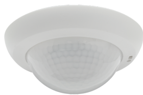
PD4N-KNXs-ST-UP Art.No: 93515

Um das Set gemäß der technischen Spezifikation zu erhalten, bestellen Sie bitte die aufgeführten Artikel.