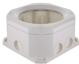
AP Montageset IP65 PD4N Art.No: 93314

Spannung: über KNX-BUS Abmessungen: Ø 106 x 55 mm Stromaufnahme: 12 mA