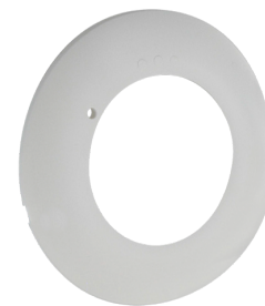
Abdeckring PD2N DE Art.No: 93772

Abmessungen: Ø 82 x 13 mm Stoßfestigkeitsgrad: IK05 Gehäuse: Polycarbonat, UV- beständig