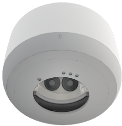
AP Montageset IP54 PD2N H Art.No: 93454

Batterie: 3.0 V Lithium CR2032 (inklusive) Abmessungen: 57 x 35 x 7 mm Farbe: -