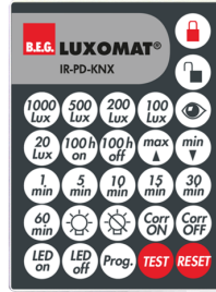
IR-PD-KNX Art.No: 92123

Abmessungen: 40 x 55 x 103 mm Farbe: schwarz Frequenz: 2.4 GHz ISM-Band, GFSK 0.2 dBm + 5.3 dBi = 5.5 dBm