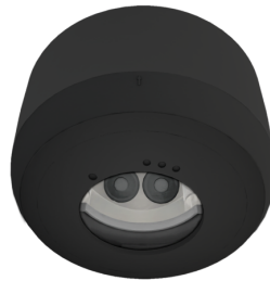
AP Montageset IP54 PD2N H Art.No: 93783

Abmessungen: Ø 110 x 65 mm Schutzart/-klasse: IP54 Farbe: weiß, ähnlich RAL9010