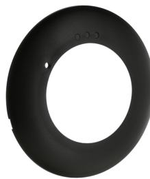
Abdeckring PD2N DE Art.No: 93773

Abmessungen: Ø 110 x 65 mm Schutzart/-klasse: IP54 Farbe: anthrazit, ähnlich RAL7012