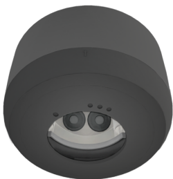
AP Montageset IP54 PD2N H Art.No: 93781

Abmessungen: Ø 110 x 65 mm Schutzart/-klasse: IP54 Farbe: verkehrsweiß, ähnlich RAL9016