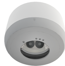
AP Montageset IP54 PD2N H Art.No: 93782

Abmessungen: Ø 110 x 65 mm Schutzart/-klasse: IP54 Farbe: schwarz, ähnlich RAL9005