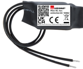
Mini-RC-dæmperled Art.No: 10882

Spænding: 230 V AC ±10% Dimensioner: 38 x 12 x 26 mm Beskyttelsesgrad/-klasse: IP20 / Klasse II